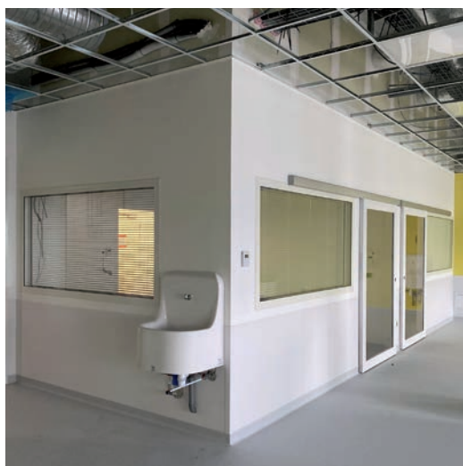
Des châssis aluminium affleurants deux faces et anti X équipent cette salle d'imagerie médicale.