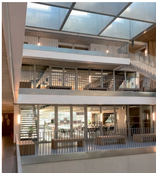
À Pontoise, les portes et châssis fixes EI30 et EI60 en aluminium de Renoval Menuiseries sécurisent les accès du campus Itescia.

le service. Consultés de plus en plus souvent et sur des lots de plus en plus importants, nous sommes en avance sur nos prévisions.